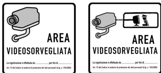
Schema modelli informativi

La presenza di un impianto di videosorveglianza dovrà essere segnalata prima del raggio di azione della telecamera, anche nelle sue immediate vicinanze e non necessariamente a contatto con gli impianti; pertanto si dovrà posizionare l'opportuna segnaletica, come gli schemi informativi riportati di seguito: